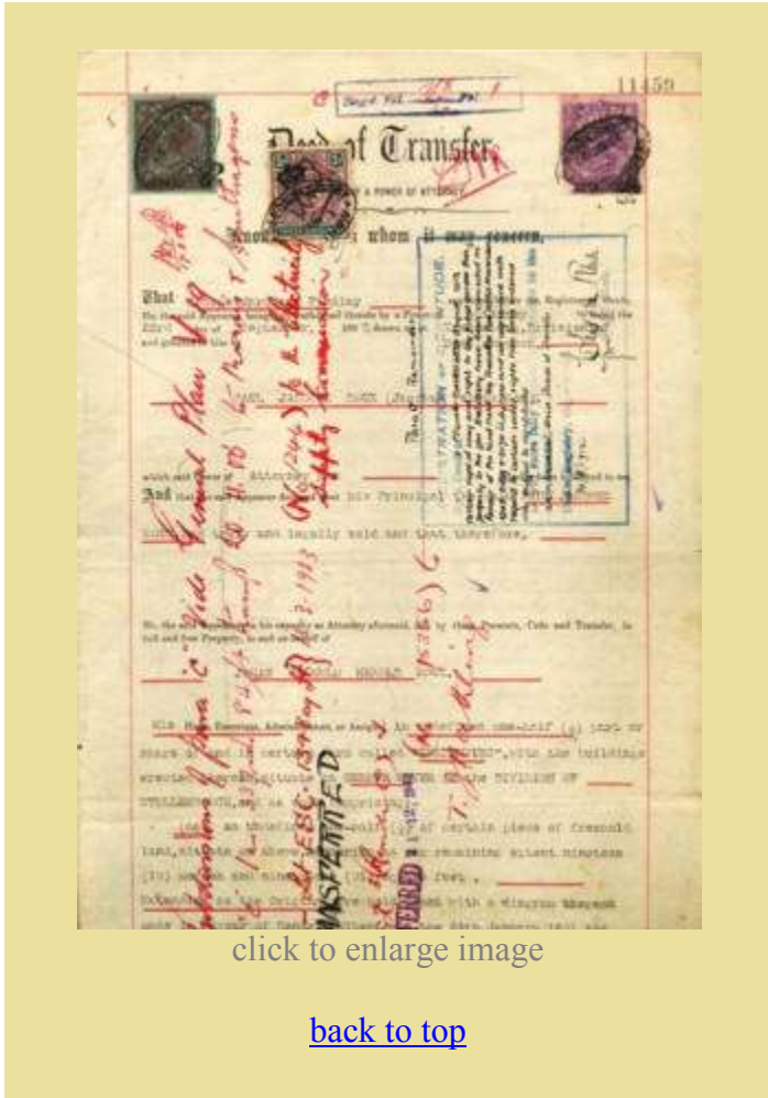
click to enlarge image